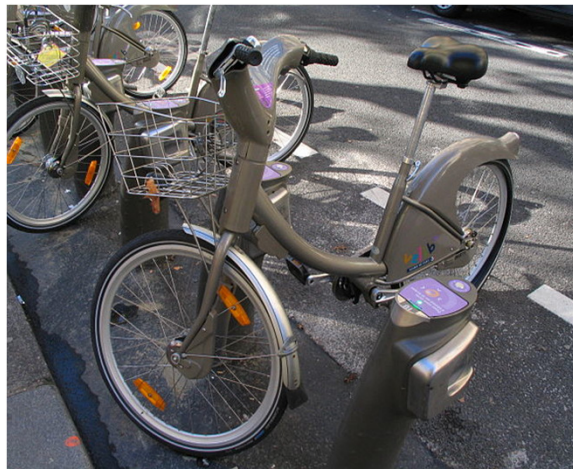
Vélos en libre service