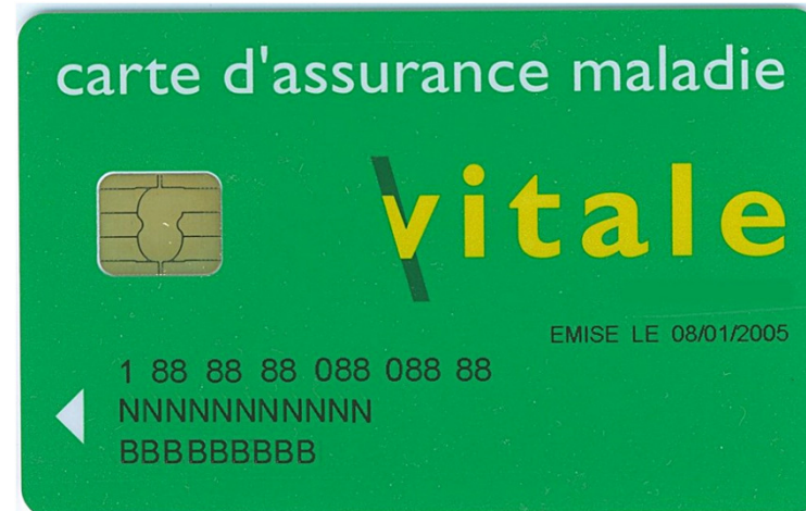
Carte à puce

Projets d'ingénierie (bureau d'étude) : utilisation de l'état des connaissances et technologies existantes